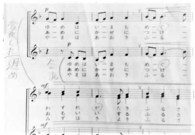
図2 B小学校 自分の考えを更新する記述