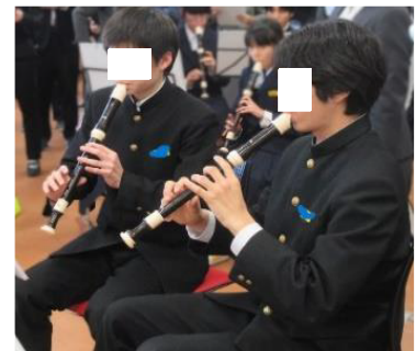
図3 C中学校 対話と試奏の様子

部分的・反復的な練習に終始していた生徒に対し、前後のつながりを意識させる発問を行うことで、曲全体を見通した具体的な表現意図が生まれた。また、振り返り後に再度吹き試す時間を確保したことで、課題を自覚し、自律的に調整しようとする姿勢が定着した。