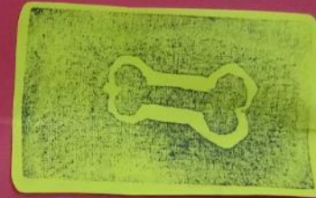
わんちゃんの ほね