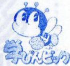
文部科学省 「学びんピック」認定大会

「学びんピック」認定大会は、児童・生徒の学習意欲の向上に資するため、さまざまな力を競い、高め合う全国的規模の大会に対して、文部科学省が認定するもので、文部科学省が大会への参加を積極的に支援しています。 ホームページは http://manabinpick.mext.go.jp/