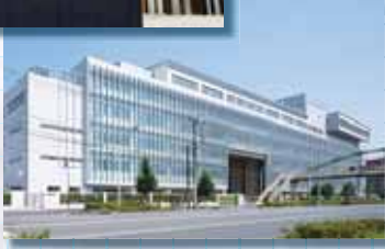
定時制側からの校舎