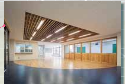
定時制エントランスホール