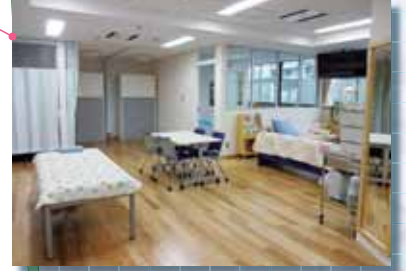
保健センター（定） 定時制専用の保健室です。