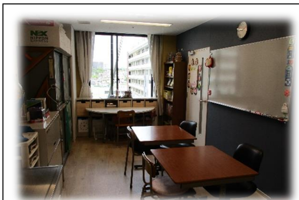
小児科病棟内の中学校教室