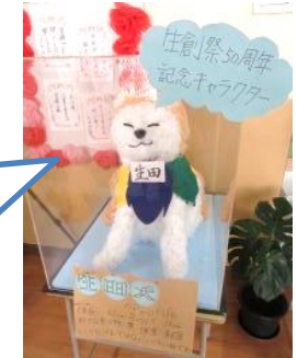
生創祭50周年記念キャラクター「生田犬」（いくたいぬ）