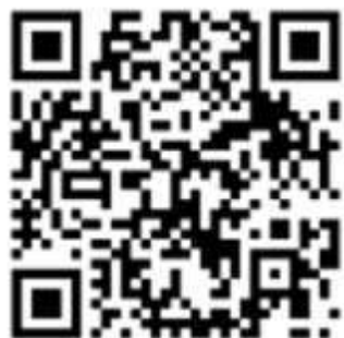
ホリスタ ホームページ

https://www.city.kawasaki.jp/880/page/0000174918.html