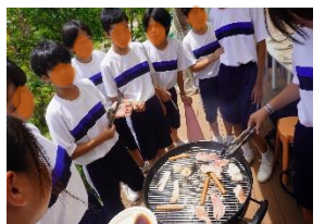
【6月 校外学習 (よみうりランド)】