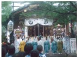
しんこうまつり 神幸祭