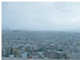
高いところから見た様子