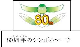
80周年のシンボルマーク

これは2番の歌詞です。この小鳥は、校庭で元気いっぱい駆け回る子どもたちを表しているのだらうなど感じます。今もこの様子は変わりません。朝、中休み、放課後と子どもたちは元気いっぱい校庭で過ごしています。元気いっぱいの向の子どもたち。校庭の子どもたちを見るたびに、みんなが安心して楽しめる学校でありたいと思ひます。