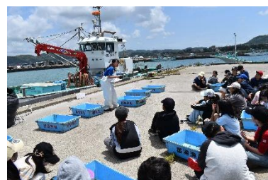
▲3日目:富浦漁港 本物の漁船の前で鮮魚の選別体験。