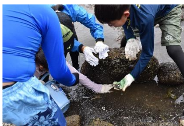
▲1日目:オオトリ浜 磯遊びで、海の生き物に触れる5年生。

子どもたちの成長を支えてくださった保護者の皆様、そして温かいご協力をいただいた皆様に、心より感謝申し上げます。