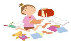
片付け・忘れ物が多い