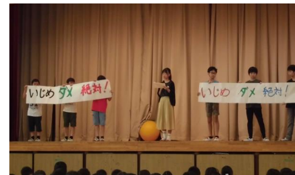
殿っ子運営委員会 いじめ防止発表