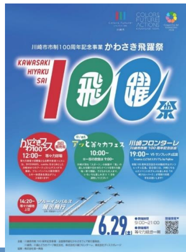
6月29日 川崎市市制100周年記念 ブルーインパルス展示飛行 周辺経路図