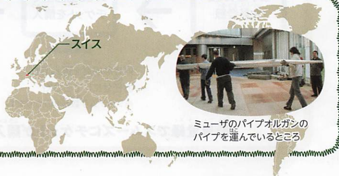
ミュージアのパイプオルガンのパイプを運んでいるところ

なんと1435年(589年前! 日本だと室町時代)に作られたんだって! 作られた時のパイプも数本残っているそうです。スイスは、ミュージアのパイプオルガンの故郷でもあります。ミュージアの楽器もスイスからはるばる運ばれてきました。ホールに来たときは、ぜひパイプオルガンを近くで見てくださいね! お待ちしています!