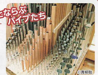
ずらりとならぶパイプたち