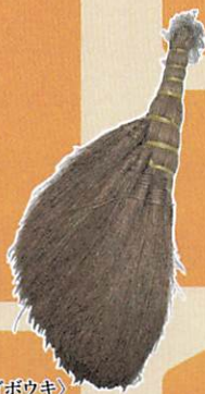
《ミゴボウキ》 川崎市大山街道ふるさと館所蔵