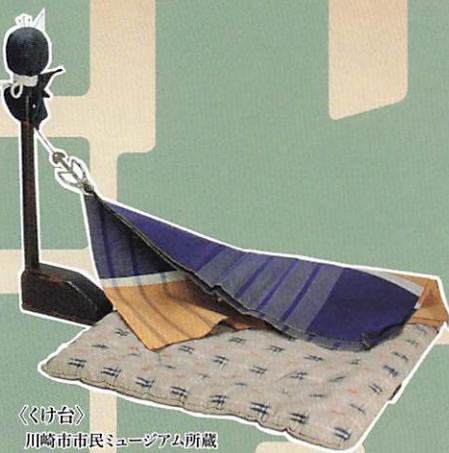
《くけ台》 川崎市市民ミュージアム所蔵