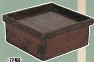
《箱膳》 川崎市市民ミュージアム所蔵