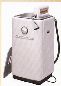
〈電気洗濯機〉 川崎市市民ミュージアム所蔵

戦後、1955年から73年の高度経済成長期に入ると、世の中はゆたかになりました。それは、技術が進歩し、家電製品が多くの家庭に普及することからも分かります。家電製品のおかげで短い時間で家事をこなすことができるようになり、人々のくらしは大きく変化しました。本展では、実際に使用されていた生活道具や当時の生活が分かる映像・写真を通して、川崎市が誕生した大正時代を軸に、その前後の時代のくらしの変化について紹介します。