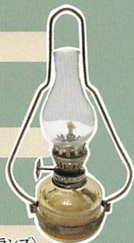
《ランプ》 川崎市大山街道ふるさと館所蔵