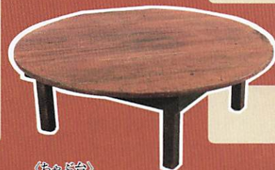
《ちゃぶ台》 川崎市市民ミュージアム所蔵