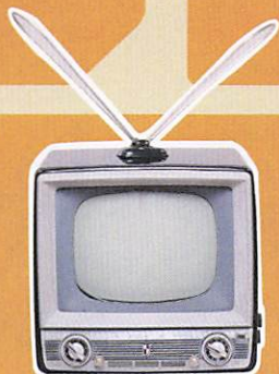
《白黒テレビ》 川崎市市民ミュージアム所蔵