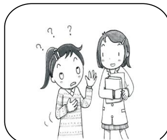
体や心について知りたい時