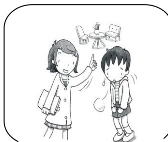
悩みや話がある時