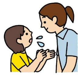
登校の不安は、信頼 できる大人に相談する