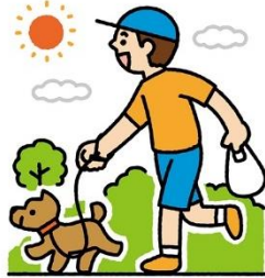
だらだらとすごさず、 適度に運動する