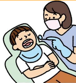
びょうきの異常は早めに 治療しておく