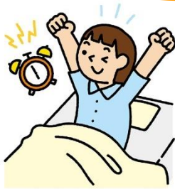
はやねはやお 早寝早起きをして、 生活習慣を整える