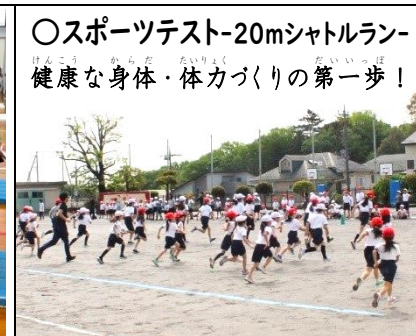
○スポーツテスト-20mシャトルラン- 健康な身体・体カづくりの第一歩!