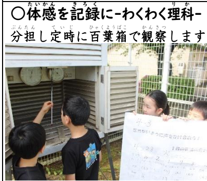
○体感を記録に-わくわく理科- 分担し定時に百葉箱で観察します