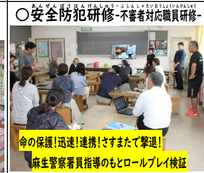
○安全防犯研修-不審者対応職員研修- 命の保護!迅速!連携!さすまたで撃退! 麻生警察署員指導のもとロールプレイ検証