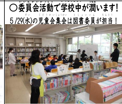
○委員会活動で学校中が潤います! 5/29(水)の児童会集会は図書委員が担当!