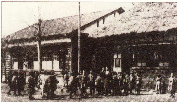
昭和15年ごろの岡上分教場