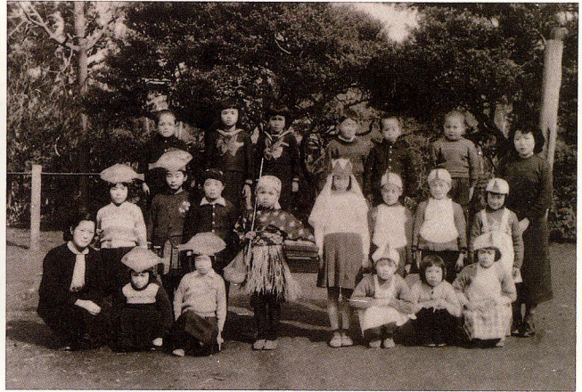
岡上分校時代の学芸会

昭和16年、屋根がスレートぶきになりました。1年生から4年生までは、ここで勉強していました。