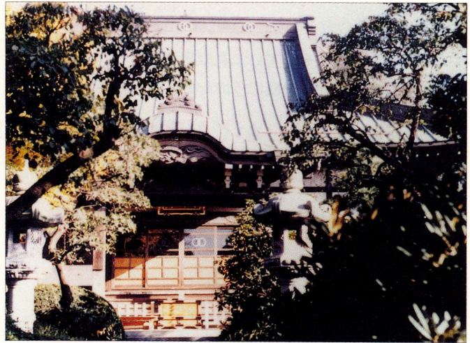
岡登学舎ができた高蔵寺

明治6年、岡登学舎が高蔵寺 こうぞうじ に作られました。そのころの岡上村には50戸ぐらいいしか家がありませんでした。