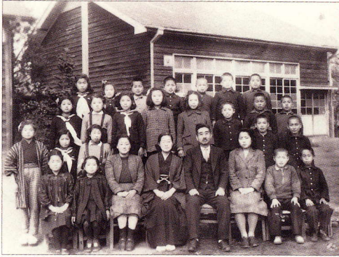
昭和25年ごろの岡上分校