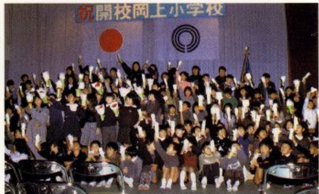
昭和62年12月5日 開校式