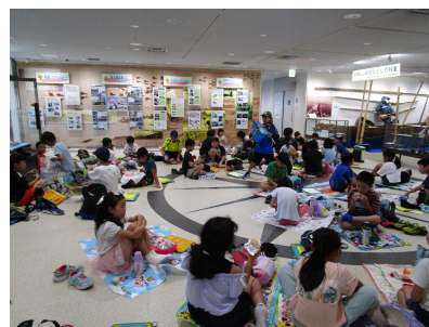
川崎マリエンで昼食