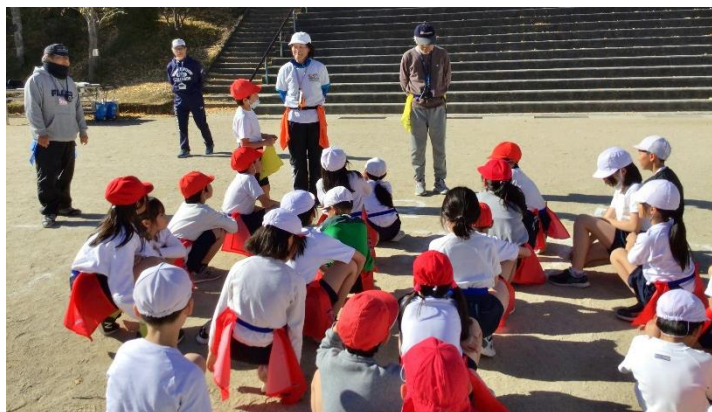
フラッグフットボールのコーチ が来て、「チームの協力が大事」 と教わる子どもたち