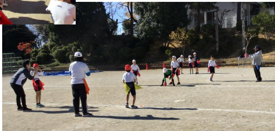
のび太君、ドラえもん、しずかちゃんの役割になり、 「レディー ゴー！」のかけ声で走り出します。