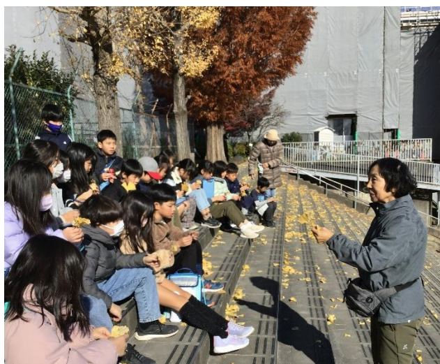
やすらぎの森博士（ゲストティーチャー） のもと、森の葉のおもしろさに気づかせ てもらおう子どもたち