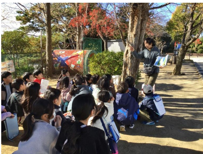
やすらぎの森で見かけるいろいろな葉 や実には、不思議なこと、興味深いこと がいっぱいでした。