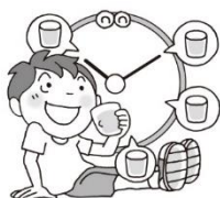
すいぶん こまめに水分をとる

ひ 日差しが つよ 強くなり、あつ 暑く感じる ひ 日が増えてきます。ねっちゅうしょう 熱中症に気を付けながら げんき 元気に過ごしましょう。