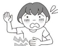
けがや たいちよう 体調が悪い ときは 先生に知らせる