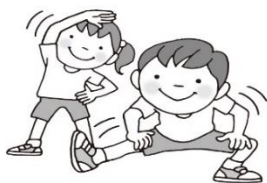
じゅんびうんどう 準備運動をしっかりとする