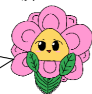
50周年キャラクター 「にじつばきちゃん」