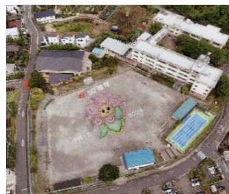
航空写真を撮りました