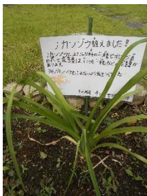
校章花ノカンゾウ成長

50周年に向けて学校全体が盛り上がってきています!写真で様々な活動や経過を紹介します。