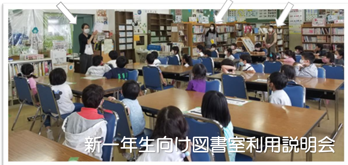
新一年生向け図書室利用説明会