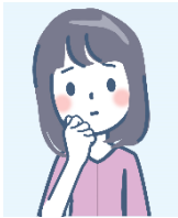
気になる A さん