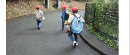
2年遠足「多摩動物公園」