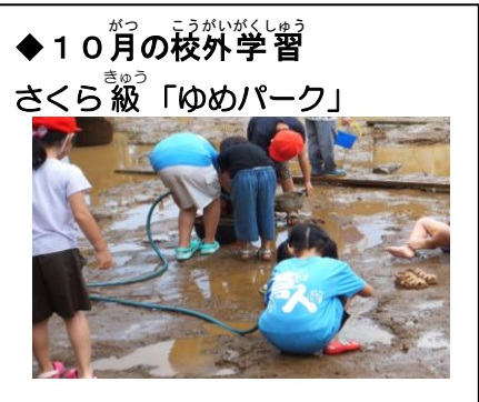
◆ 10月の校外学習 さくら級「ゆめパーク」