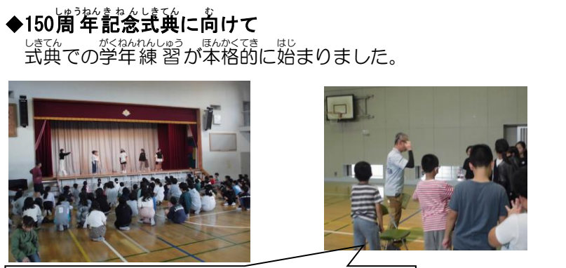
◆ 150周年記念式典に向けて 式典での学年練習が本格的に始まりました。

◆ 担任交代について さくら級担任の小辻陽平教諭が10月29 日より育児休業に入ります。中島裕美教諭 が後任として引き継ぎます。また、29日より、 清水説子教諭もさくら級で指導を行います。