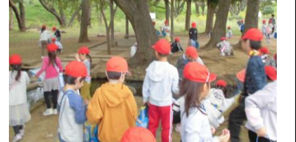
1年生活科「稲田公園」

◆ 自分の思いを話す 前期終業式では1・3・5年の代表児童、後期 始業式では2・4・6年の代表児童が「前期の振り 返りと後期にがんばりたいこと」を全校児童の前で 話しました。 その話を真剣に聞く姿が見られました。代 表児童が話し終わって、ステージから下りるとき には、1年生が「すごい」「みんな上手」とつぶや いていました。 この話す姿は、朝の会のスピーチや授業での 発言の積み重ねがあってできることです。これから も、各クラスで「自分の思いを話す場」を大切に していきたいと思います。