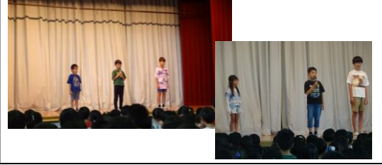
次号は、11月27日に発行する予定です。

◆ 自分の思いを話す 前期終業式では1・3・5年の代表児童、後期 始業式では2・4・6年の代表児童が「前期の振り 返りと後期にがんばりたいこと」を全校児童の前で 話しました。 その話を真剣に聞く姿が見られました。代 表児童が話し終わって、ステージから下りるとき には、1年生が「すごい」「みんな上手」とつぶや いていました。 この話す姿は、朝の会のスピーチや授業での 発言の積み重ねがあってできることです。これから も、各クラスで「自分の思いを話す場」を大切に していきたいと思います。