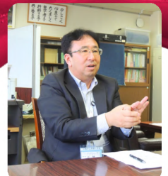
校長先生にも取材。学びの多いひと時でした。

年に何度か発行するPTA広報誌の作成・編集を行っています。令和6年度から無料のスマホアプリを使用し、最終調整以外はスマホと指2本のみで作成できるので、高度なパソコンスキルは不要になりました。