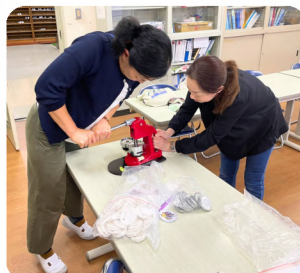
真心を込めて...缶バッジの製作中。