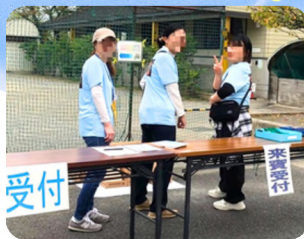
運動会のお手伝い