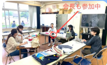
本部の定例会。出席できなくても大丈夫。情報は全員で共有されます。

例えば、従来は決め事や話し合いを学校に集まって進めていたところを、現在は主にオンラインツールを使用して行っています。とは言え、顔を見て話した方が良いケースもあるので、そういう時は学校に集まって話し合いをします。このように、対面とオンラインのいいとこ取りでコミュニケーションを取っています。