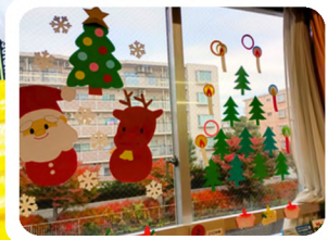
校舎の北側からも見えるので、通りがかりの際にぜひチェックしてみてくださいね!

季節に合う飾りで図書室の窓を装飾したり、朝の読書時間にそれぞれのクラスで読み聞かせをしています(年6回)。また、中休みに図書室でお話し会を開きます(年3回ほど)。メンバーは自分がやりたい活動を自由に選んで参加しています。