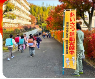
おはようございます！