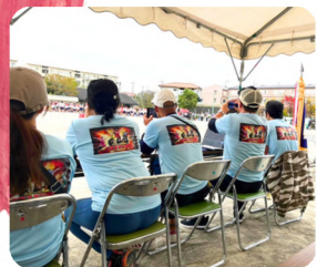
本部役員はテント下の特等席でゆったり鑑賞できます。