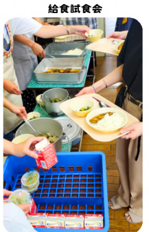
童心に戻って、我が子と同じメニューをいただきます。

学校を舞台にして、親子で楽しめるイベントを企画します。例えば、給食試食会では七夕にちなんだ給食に舌鼓を打ちながら栄養士さんからお話を伺ったり、夜の校庭で月や惑星などの観測をしたり（子どもたちも夜の学校に大喜びでした!）、ランドセルを用いた護身術教室を開催したり。参加者の反応がダイレクトに伝わってくる、やりがいを感じるお仕事です！