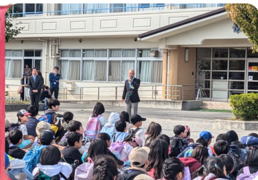
ふれあいまつり、始めます！