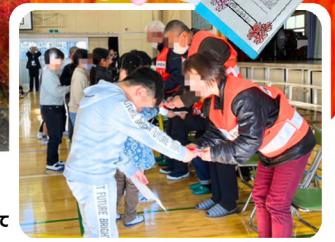
安心安全お礼の会にて。「いつも見守ってくださいありがとうございます。」

普段何気なく行き来している通学路。学区は比較的静かなエリアということもあり、一見すると安全のように見えますが、実は危険がいっぱい潜んでいます。地域の安全は、学校、保護者、そして地域の方々の三者が揃ってこそ成り立ちます。三者のつなぎ役を務めるのが校外委員会です。年3回のあいさつ運動、学区内のパトロール、'子ども110番の家'の依頼、安心安全お礼の会で保護者を代表して感謝の気持ちを伝えます。