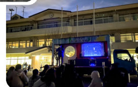
夜の帳がおりた校庭で。アストロカーによって天体観測教室に早変わり。