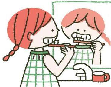
3度のご飯を食べた後は ていねいに歯みがき