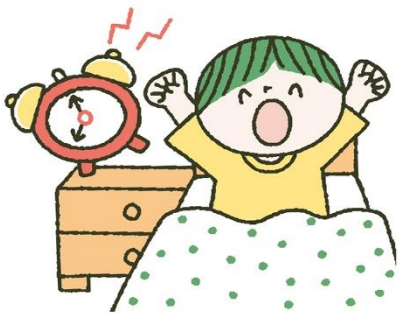
早寝早起きを続けて しっかり睡眠をとる