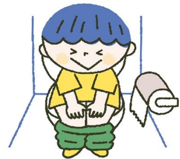
毎日、同じ時間にトイレ 排便習慣を守ろう