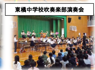
東橘中学校吹奏楽部演奏会

お願い 久末小学校では、名前で呼び合うためにうわばきに名前を書くことになっています。お子さんのうわばきに記名をされているか確認をお願いします。 なお、アルファベットはわかりづらいので、漢字、ひらがななど日本語で記名してください。(二か所)