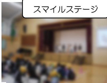
スマイルステージ