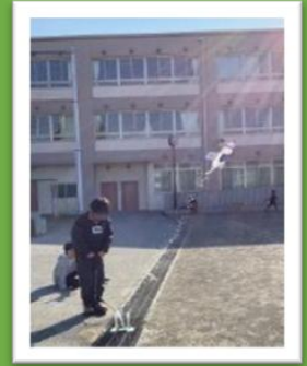
ペットボトルロケット