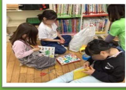
係活動始めました！