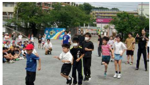
学校評価に関わる12の項目