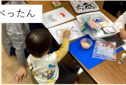
ちょきちょきぺったん