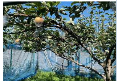
ちょうじゅうろうなし 長十郎梨の木

生揚げと野菜たっぷりの中華スープです。今までは、衛生上暑い時期の生揚げを使用制限しておりましたが、冷凍生揚げ(国産大豆)を使用します。