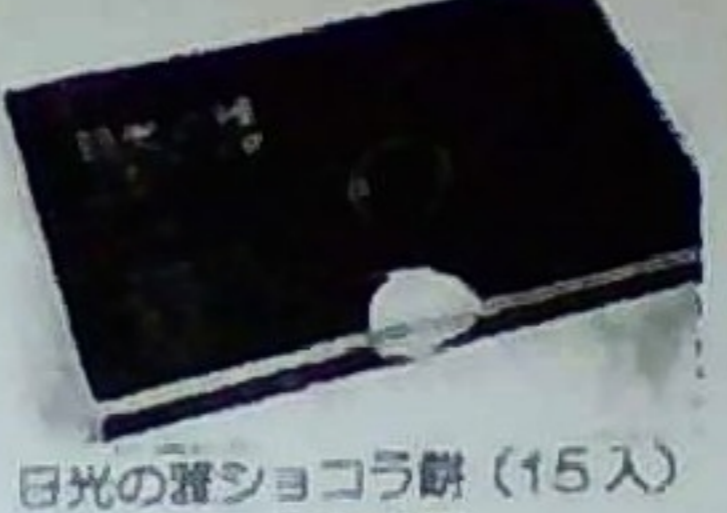
日光の暮ショコラ餅 (15入) 650円