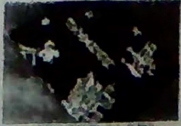
基五郎煎餅 (16枚) 870円