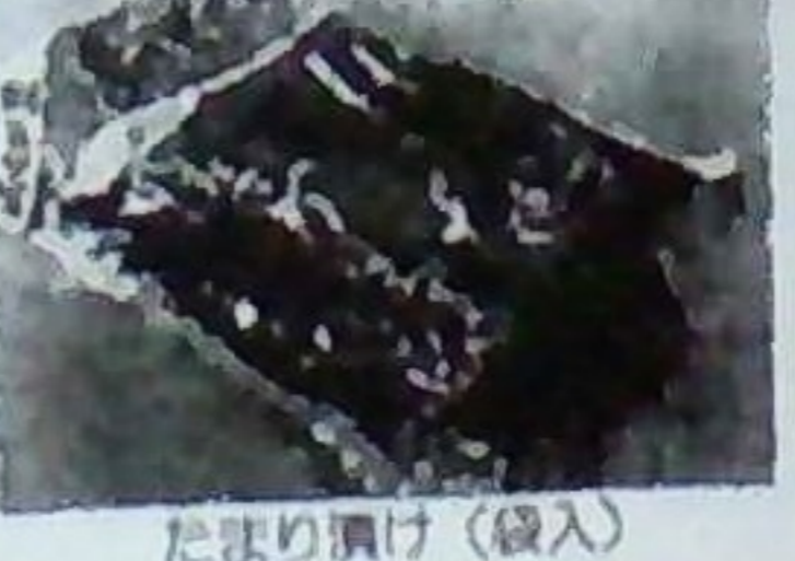
たまり漬 (袋入) 640円より