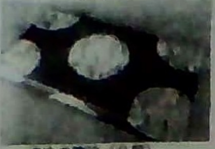
さぬの清流 (8個) 870円