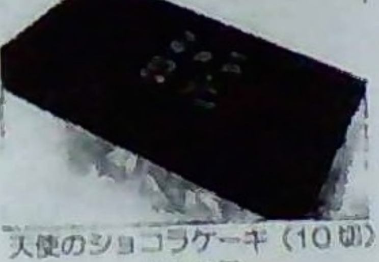
天使のショコラケーキ (10個) 440円