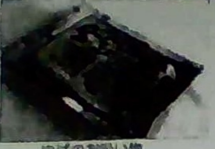
ゆばのお祝い物 650円