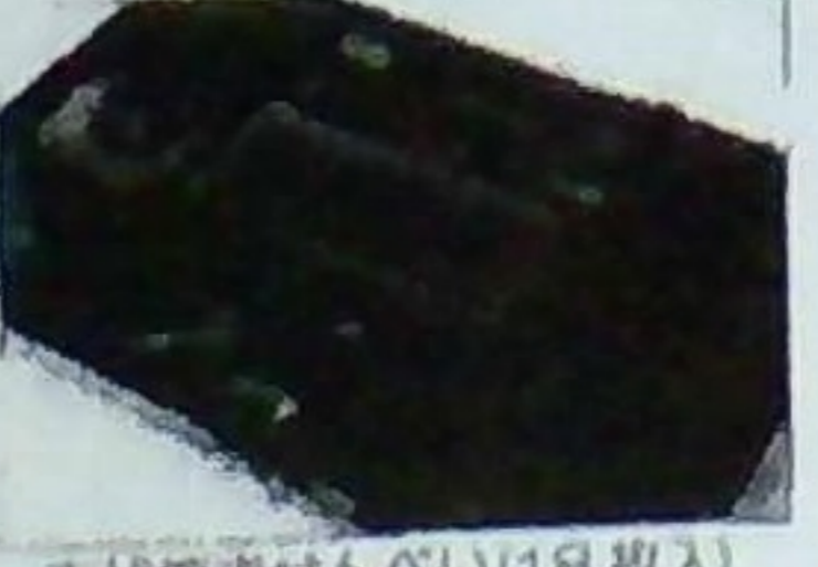
古代焼きせんべい (18枚入) 650円