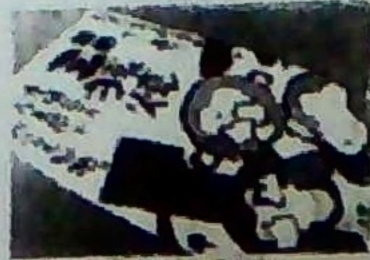
三猿餅 (10個) 650円