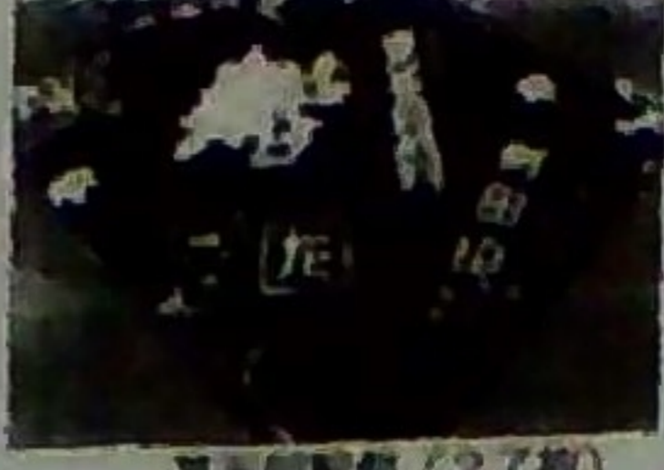
基五郎煎餅 (27枚) 1300円