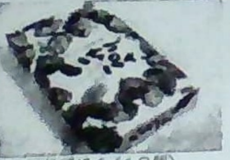
いちごパイ (10個) 380円