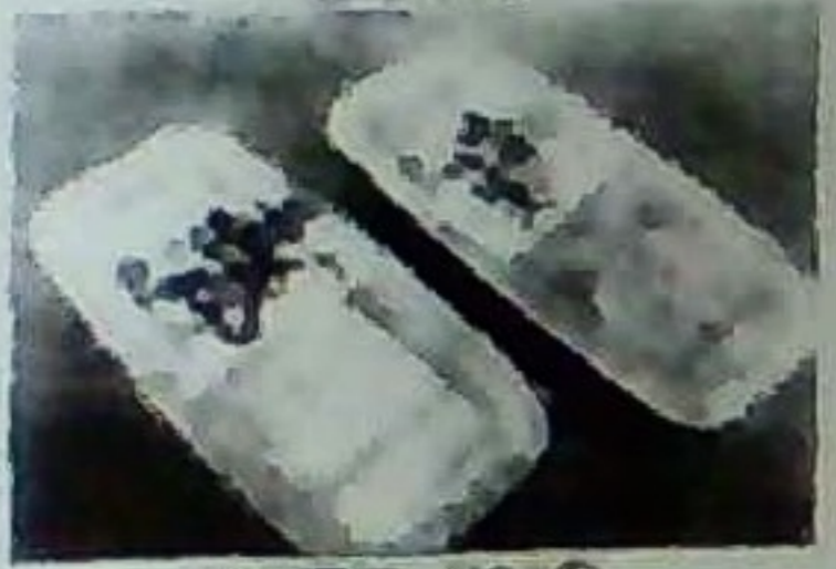
日光湯敷 (ゆば) 600円より