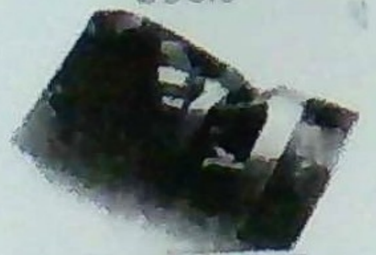
チョコレートビスコッティ 440円