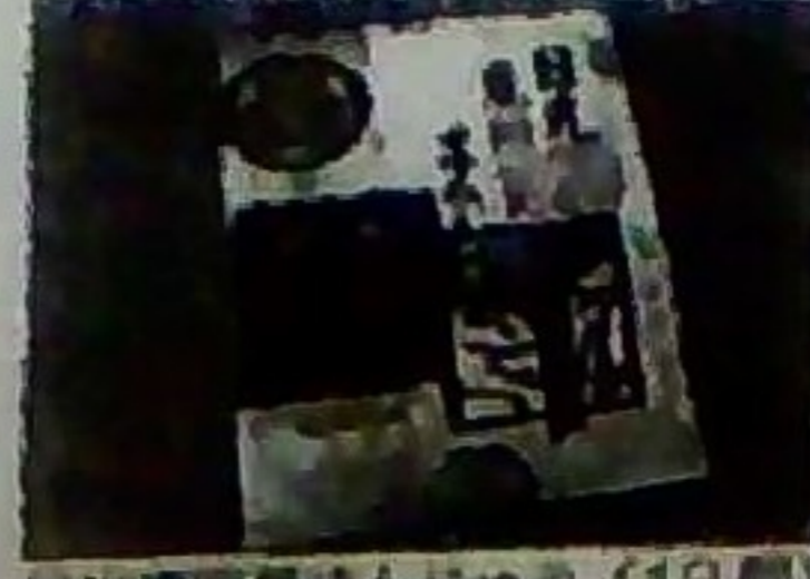
日光温泉あんじゅう (12個) 700円