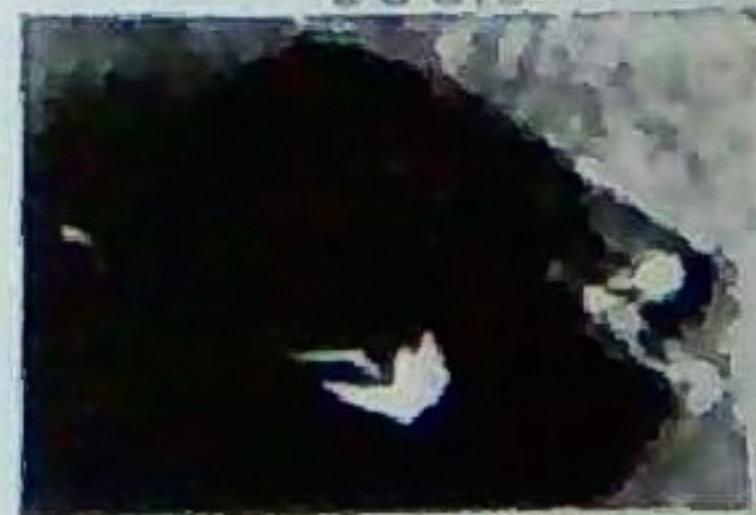
基五郎煎餅袋入 (18枚) 650円