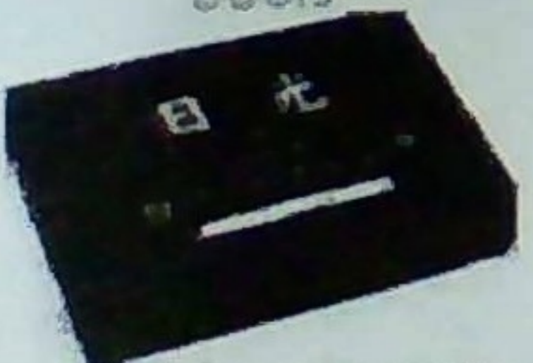
日光ロイヤルショコラ (8個) 380円