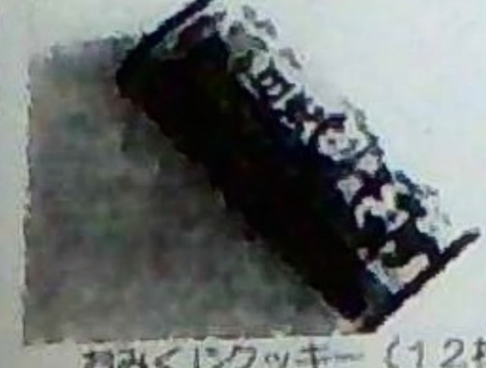
おみくじクッキー (12枚) 540円