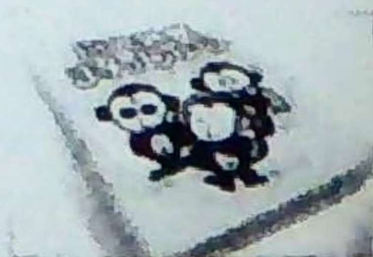
日光温泉まんじゅう (9個) 600円