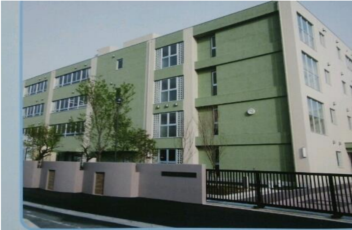
川崎市立東高津小学校