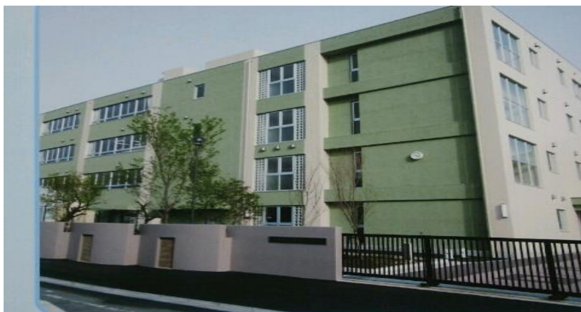
川崎市立東高津小学校