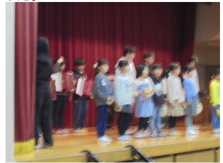
朝会に向けて実行委員さんが準備中です。