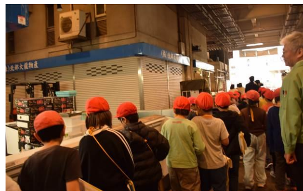
3年「川崎市北部見学」北部市場では市場で働く人の工夫に気づき、たくさん質問をして新しい発見をしました。