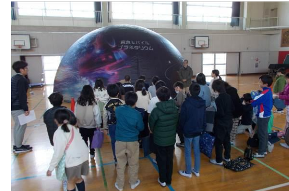
4年「月と星」体育館に設置したプラネタリウムで冬の星座や星は時間と共に位置が変わることを学びました。