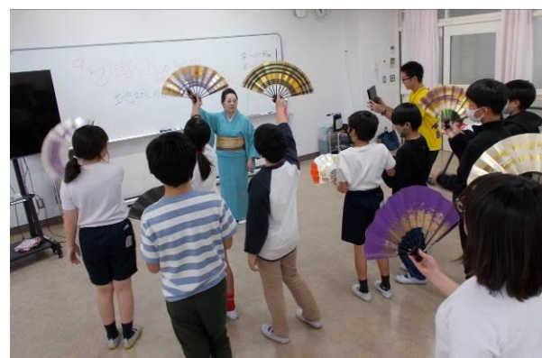
5年「ウェルビーイング」地域の方から幸せと感じる趣味や体験について教えていただき、自分や周りの人の生活が豊かになる方法や幸せについて考えました。