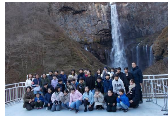
6年「日光修学旅行」毎日一緒に過ごしてきた大切な仲間と共に、日光の歴史や自然を満喫しました。素敵な思い出の2日間となりました。