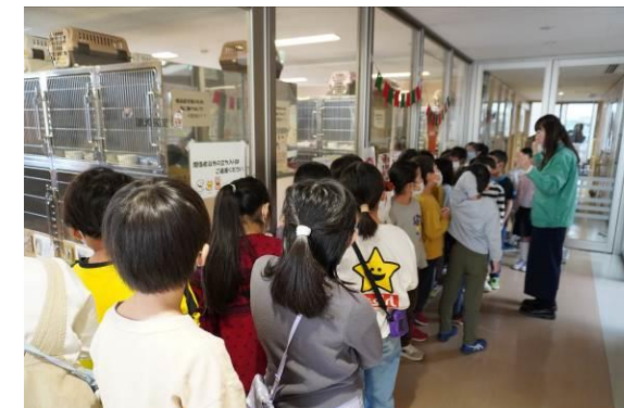
2年「川崎市動物愛護センター見学」動物も人間と同じように命があり、気持ちがあることを学びました。