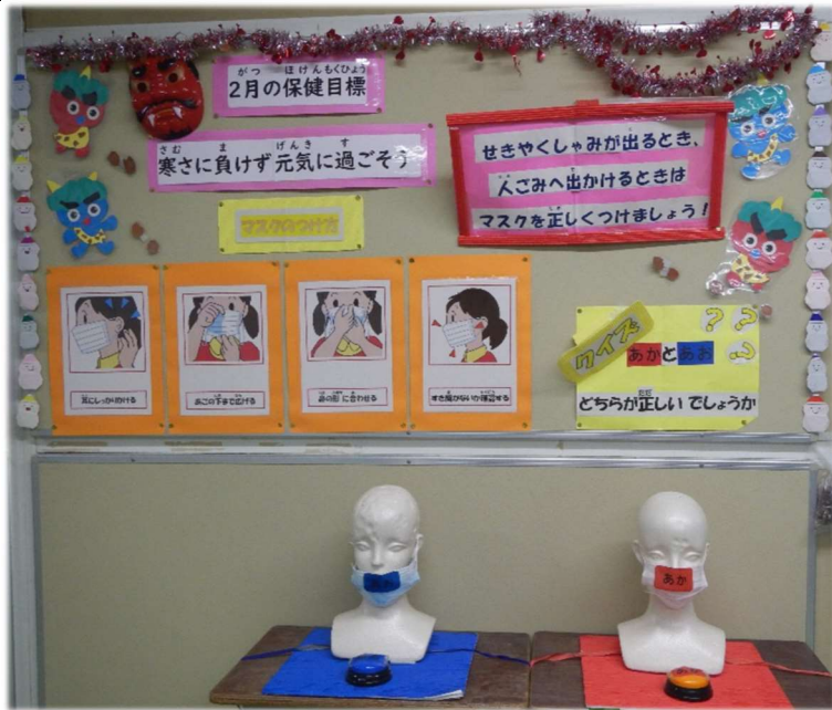
ほけんしつまえ けいじぶつ 保健室前の掲示物