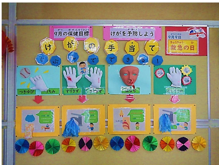
ぼけんしつまえ けいじぶつ 保健室前の掲示物

うちみのときは、冷やしたり、すり傷のときは、水で洗ったりして自分でできる手当てを気にしたり、確認したりしていました。