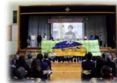
▲5年「人を思う気持ち」