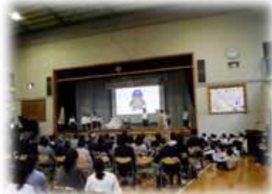
▲3年「東小倉 魅力発見」