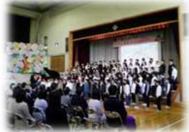
▲4年「一人ひとりのよさ～みんなの心に響く歌～」