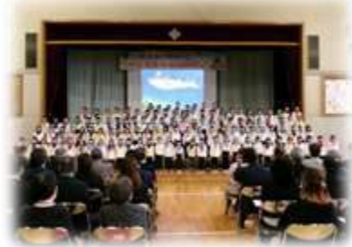
▲1年「40周年の東小倉っ子をお祝いするみんなの気持ち」