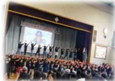
▲2年「すてきがいっぱい東小倉のまち」