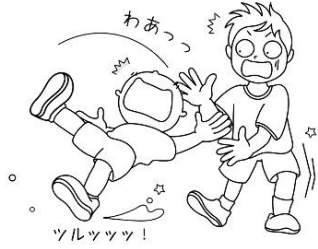
すべりやすい廊下