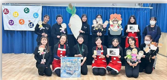
小道具作りから演出まで楽しく準備しています