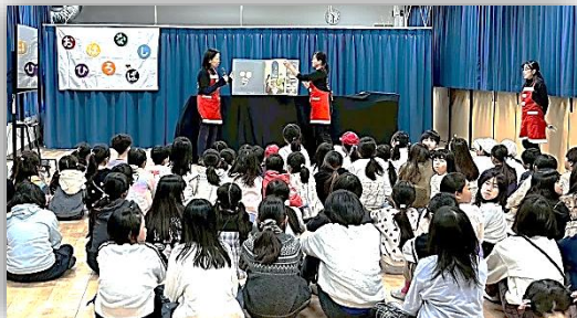
大型絵本の読み聞かせ