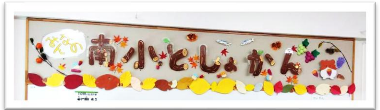
南小図書館 壁装飾