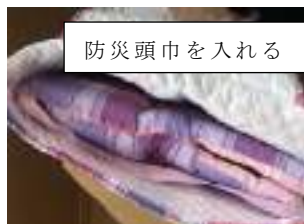
防災頭巾を入れる