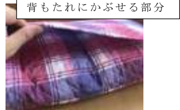
背もたれにかぶせる部分